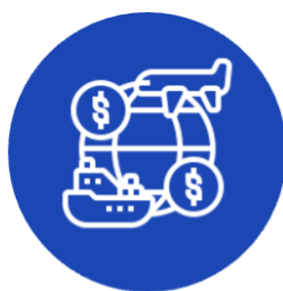
Capítulo 14. Inversión