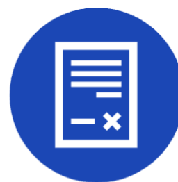
Capítulo 32 Excepciones y disposiciones generales