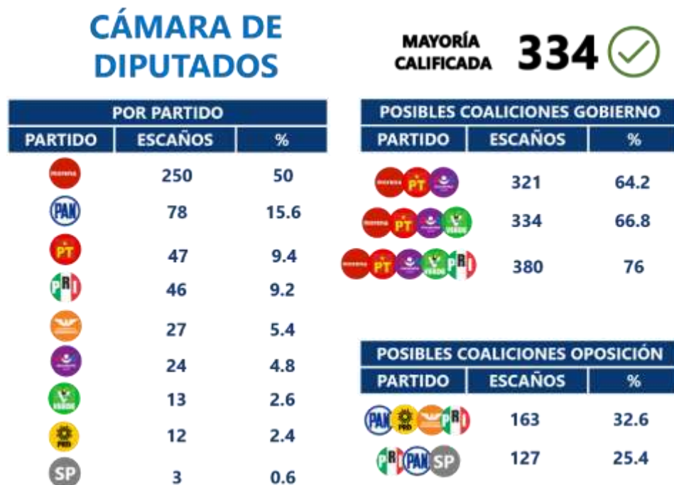
Cuadro 1. Composición actual de la Cámara de Diputados con las adiciones del PT

Fuente: Gaceta Parlamentaria de la Cámara de Diputados. Actualizado al 28 de agosto de 2020, 19:23 horas.